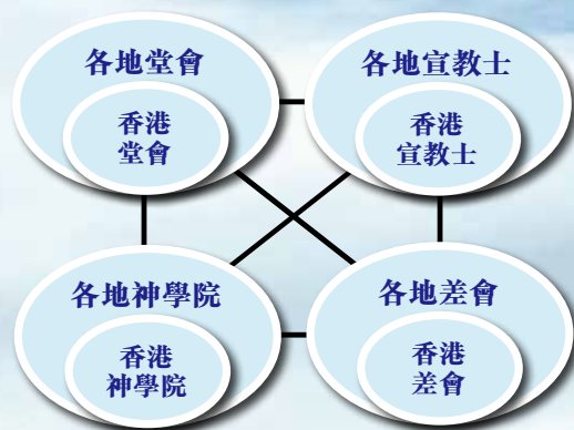
圖三：普世教會透過伙伴合作完成天國使命

（Global Initiative）功能單位，透過動員在工場中的本土基督徒群體起來投身參與穆宣，從而在世界舞台建立更多元化的宣教團隊，務求以各式各樣的方法把福音帶給穆斯林。